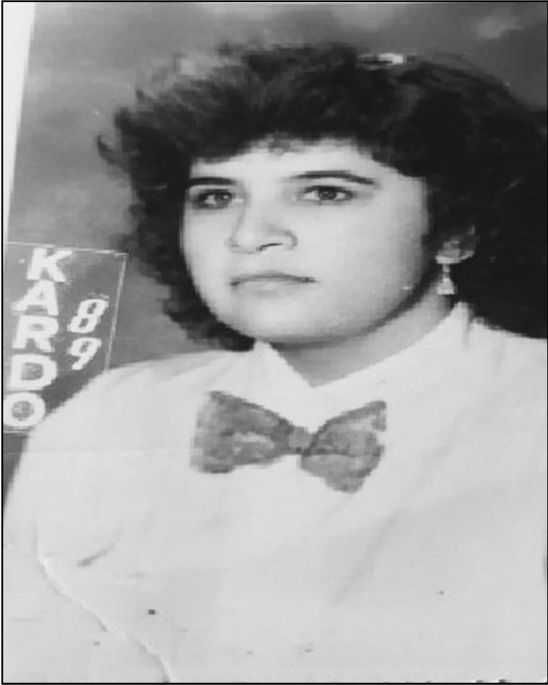
ویژہ شہرئف ہاورئ (شہنگہ)، لہ دایک بووی ۱۹۶۶ ہاوسہ رگری کردوہو لہ سوید نہڑی، خواہنی (۱) منان