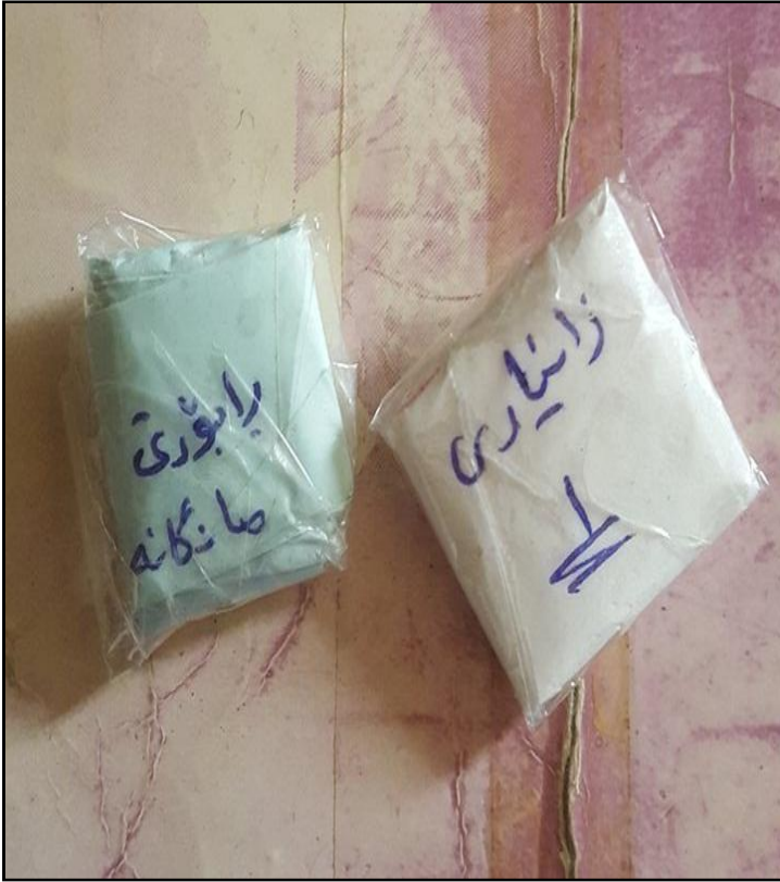
(وینہی ژماره ۱) نامه نوقلیبہ کان