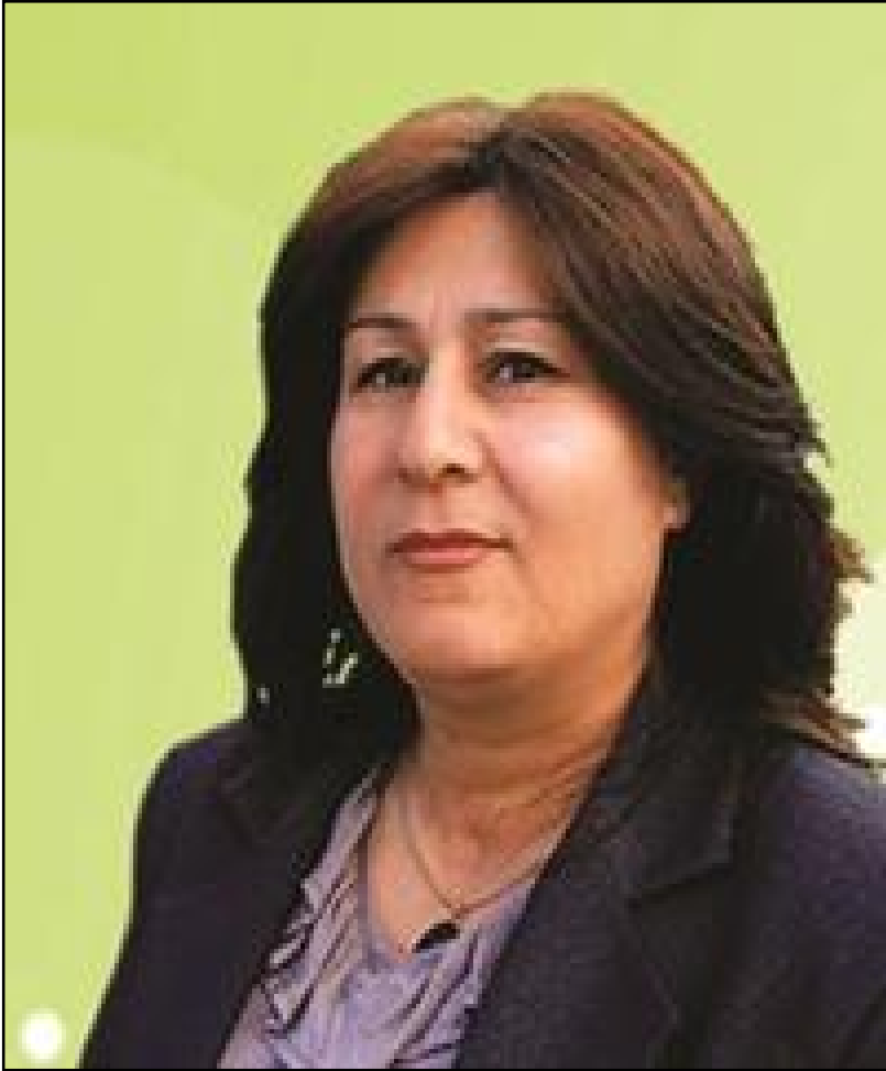
شہوقیہ کاکہ حمہ (هاوړی نارایشټ)، ۱۹۶۱، جیگری بهرپوهبهری گشتی کاروکاروباری کومه لایه تی، خاوهنی (۲) منان