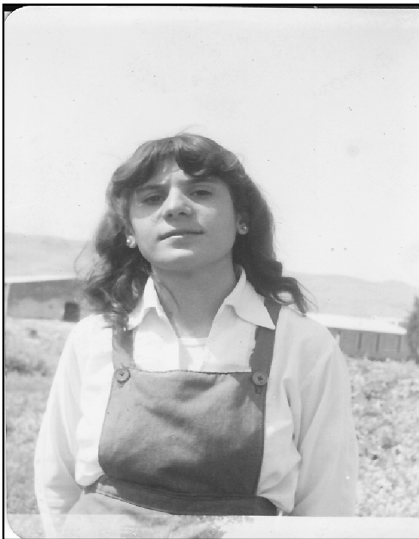
سه‌رده‌می ریکخستن سالی ۱۹۸۵