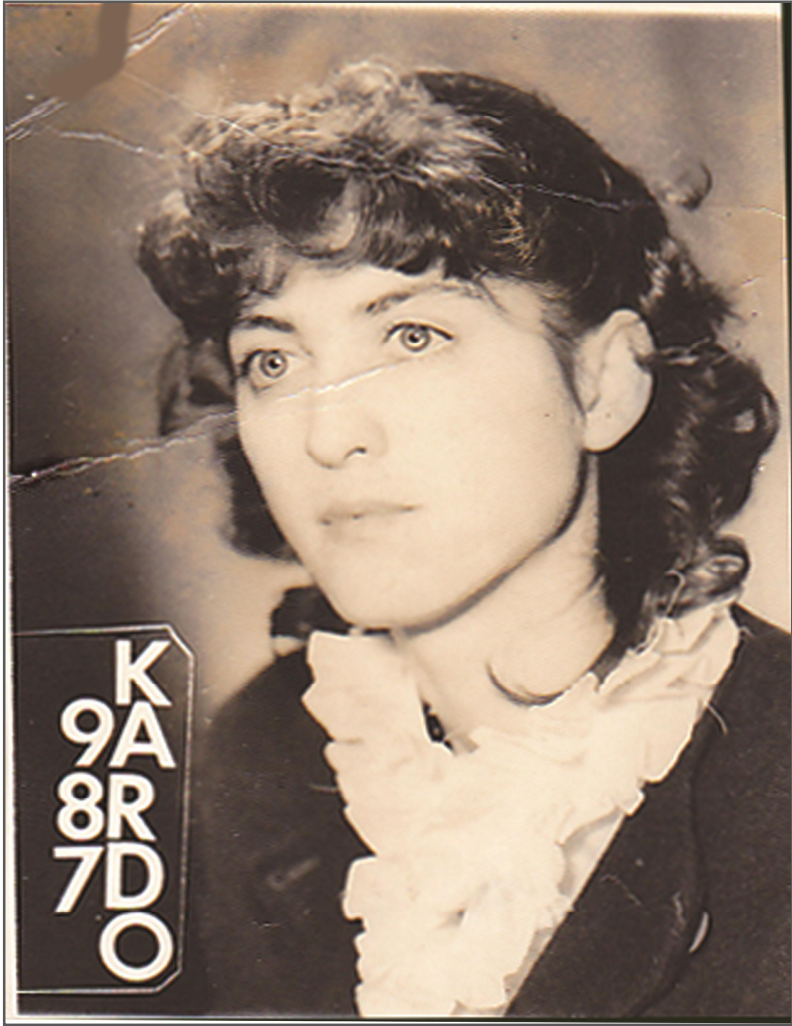
شانۆ محه ممههه (هاورئ شه وپۆ). له دايك بووى ١٩٦٩ هاوسه رگيرى كردوووه له رۆژه لاتی كوردستانه ، خاوهنى (٢) منان