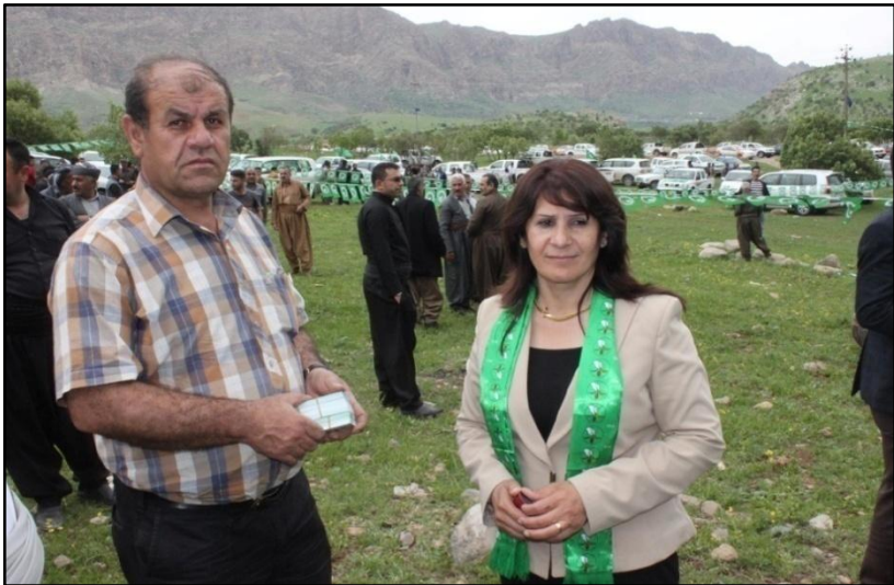
کاندید بووم بو نه نجوومه نی پاریزگای سلیمانی - سائی ۲۰۱۳

نه گه ل هاوسه ره که مدا بانگه شهی هه ئبژاردن