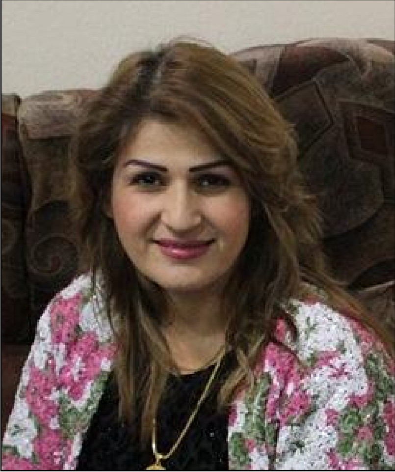
نہ شمیم مہ حمود کہریم (ہاوری پاورٹیکار) دکتورہ لہ به شی پاراستنی کومہل و خواوہنی (۴) منائہ