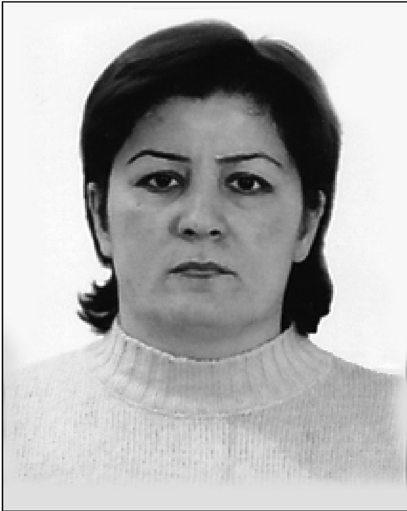
شیرین مه حمود - خیزانی شهید علی حسین محمد عثمان خاوهنی (۲) مندائه - له دایک بووی ۱۹۶۵