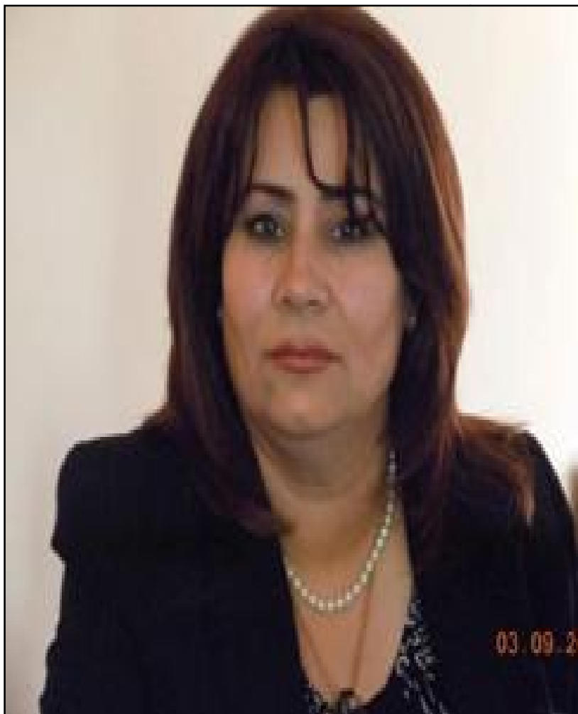
په روین کاکه همه (هاوړی که ژدوست) نه ندای سهر کردایه تی (ی. ن. ک) و خاوه نی (۲) منایه