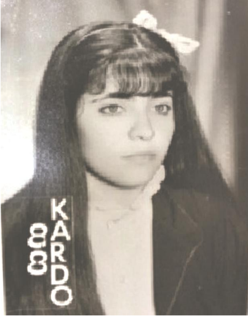
دیدار محہ مہد (ہاوری شینی) نہ دایکبوی ۱۹۶۶ - ماموستای ہونہر، خاوندی (۲) منان