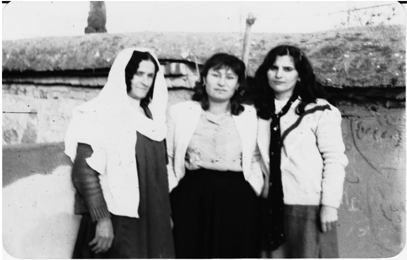
په خشان سائح نه جمه دین - شهوقیه کاکه حه مه - خاتوو عه دله (دایکی خاتوو جه میله )