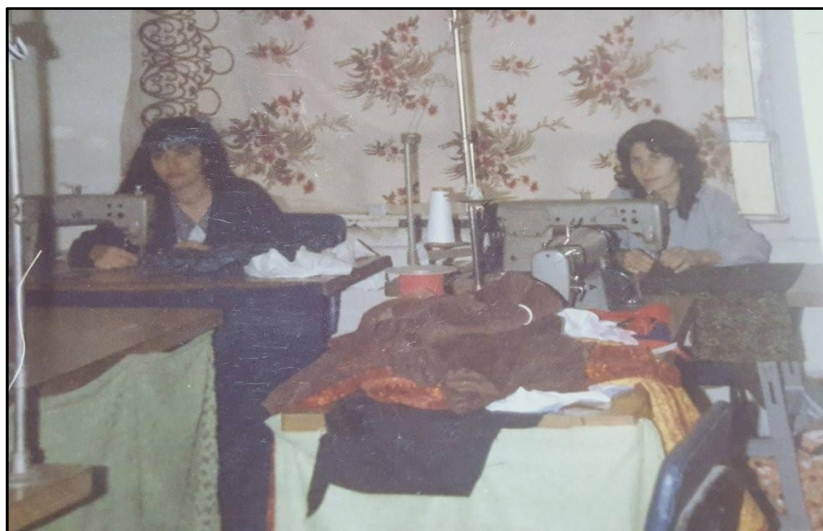
من و دیداری هاوریم نه کارگهی بهرگدوورین