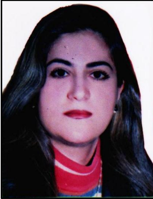
شیرین جہمال جہلال خہزنہ دار ہاورئ (شو خان) خاوہنی (۲) مندائہ